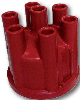
BOSCH : 1 235 522 060 BERU : VK 102