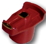
BOSCH : 1 234 332 024 KW : D 5026